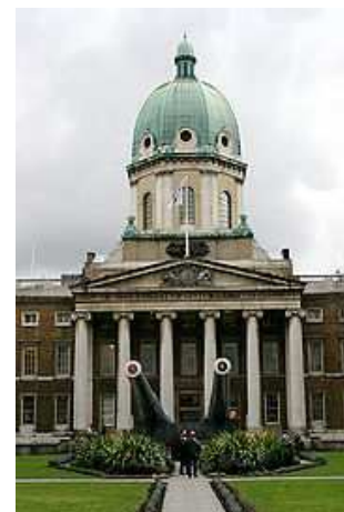
Imperial War Museum